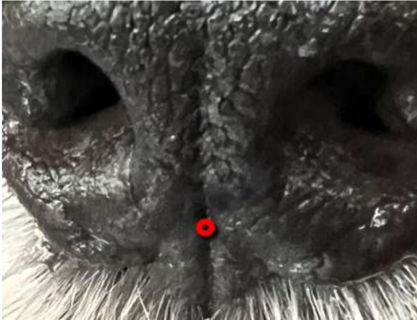
Le point GV26

L'aiguille est insérée perpendiculairement, au point rouge indiqué sur le nez de ma chienne, au centre du Philtrum, à la base des narines, assez profondément pour permettre un mouvement de va et vient sans que l'aiguille ne soit retirée et ce pour une période d'au moins 30 secondes. La procédure peut être répétée. Elle accroît le flux sanguin, relâche des opioïdes pour diminuer la douleur et réduit l'inflammation. On dit que l'effet sur la fréquence cardiaque et la pression artérielle a un effet comparable à l'injection d'épinéphrine.